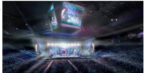
音楽イベントなど世界に誇るスマートアリーナ