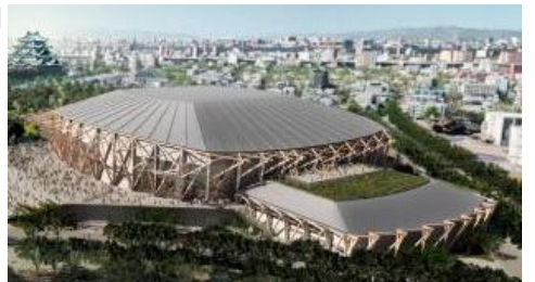
IGアリーナ(愛知国際アリーナ)が7月OPEN!

● 中小建設業における DX の推進 働き方改革や生産性の向上を図るためデジタル化を進めようとする中小建設業に啓発事業の実施やシステム導入補助(県発注の工事受注者、1/2、上限 50 万円)などに 0.12 億円