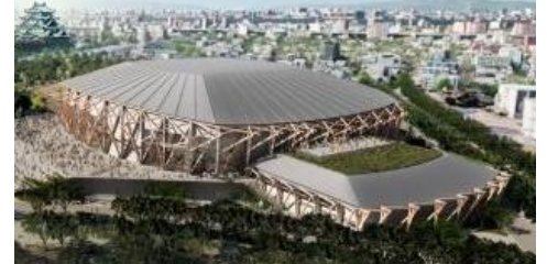
愛知国際アリーナ(IGアリーナに名称決定)