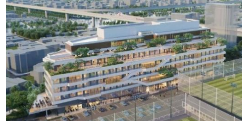
STATION Ai 2階にあいち創業館を整備