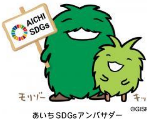
あいちSDGsアンバサダー