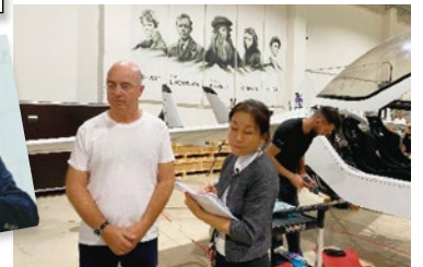
●イスラエル訪問団副団長としてスタートアップ調査