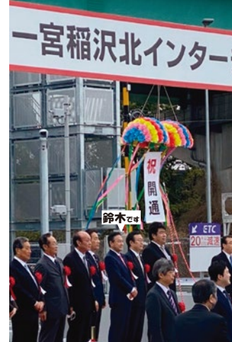
●東海北陸自動車道一宮稲沢北IC開通