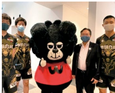
●豊田合成記念体育館エントリオを拠点とするウルフドッグスのウルド君と