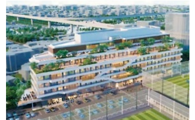
●昭和区に建設中のSTATION Ai