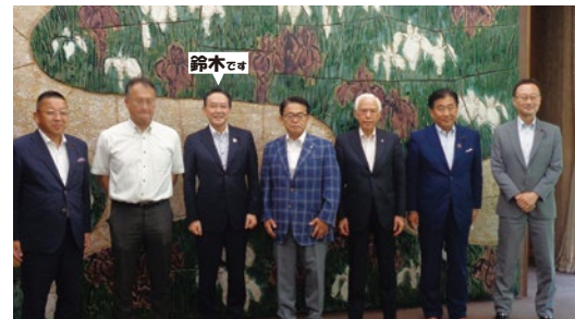
●中小企業振興議連会長として知事表敬訪問