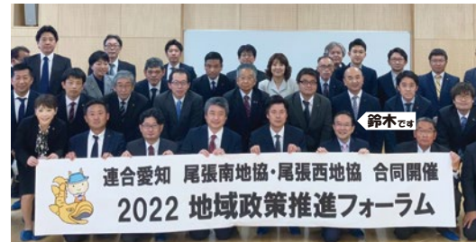
●連合愛知のみなさんと研修会