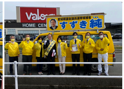
平和パローさん前