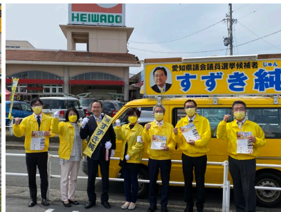
祖父江平和堂さん前