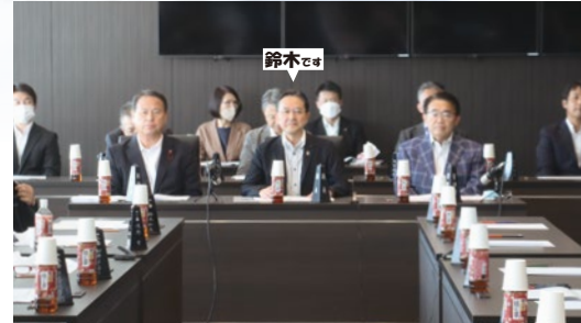
●愛知県競馬組合議長