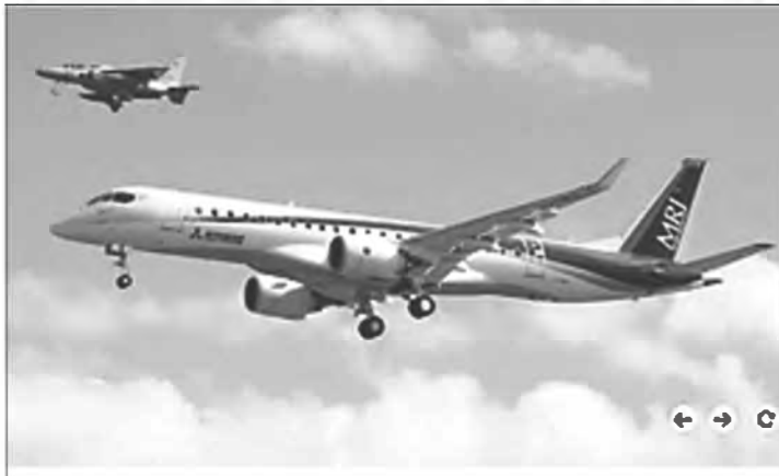
航続距離約 3,300 km、最高速度約 900 km/h、開発費約 2 千億円超 (販売価格 92 席タイプで約 56 億円)といわれる MRJ 初飛行に成功！