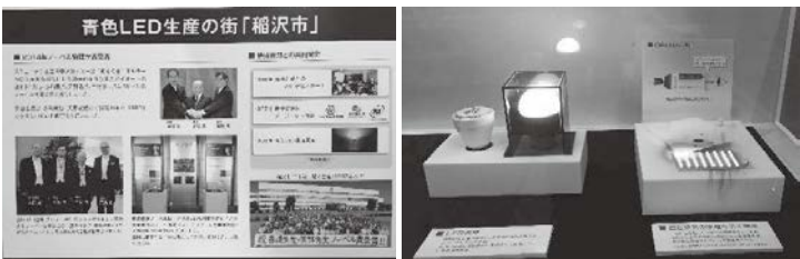
稲沢市役所の1階ロビーに展示されている豊田合成平和工場の発光ダイオード