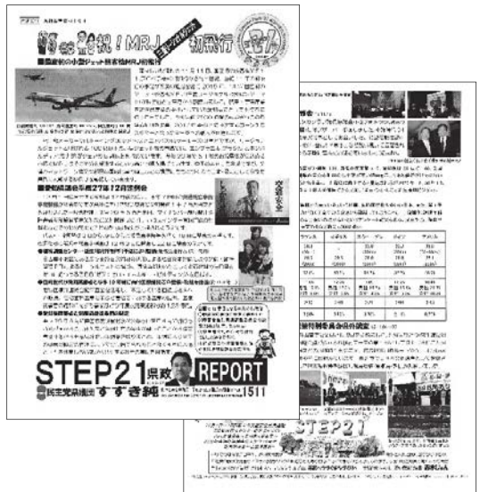
●浅田真央選手 GP シリーズ復帰優勝 ●パリで同時多発テロ