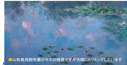
●山形美術館所蔵のモノの理連ですが大幅にトリミングしています

市制 60 周年・開館 35 周年記念事業として「山形美術館の名品と荻須が見たパリ画壇」を開催…教育委員会 110 万円