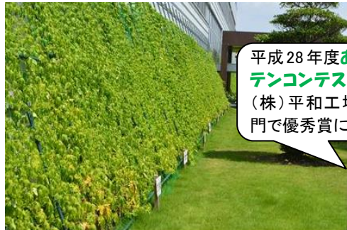
平成28年度あいち緑のカーテンコンテストで豊田合成(株)平和工場が事業所部門で優秀賞に輝きました。