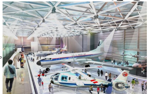
●国産初の旅客機YS-11、MU-2の実機展示等