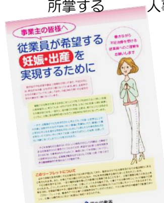
厚生省は晩婚化を背景に不妊治療が増加、働きやすい環境は人材確保にと...