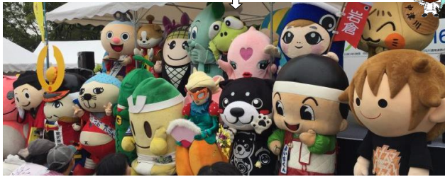
稲沢サンドフェスタ in サリオパーク祖父江