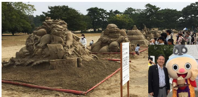
稲沢サンドフェスタ 国民文化祭・あいち2016のフンソーも登場

10月14日に閉会した9月定例会議では、83億37百万円一般会計補正予算、県営名古屋空港の見学者受入拠点施設展示物整備基金の設置などの条例関係7件、防災ヘリの買入や教育委員会委員の選任などその他議案20件の合計28議案を一部反対・賛成討論を経て可決・同意しました。また、難病対策の充実、地方財政の充実・強化、治水対策の推進、地方創生に係る新型交付金等の財源確保などについての意見書を採択しました。