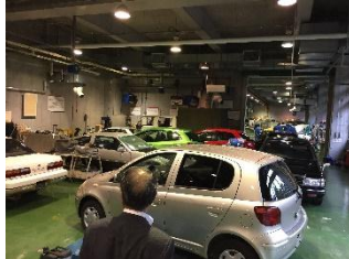
東京都立六郷工科高等学校