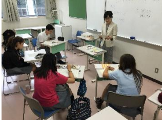
東京都立国際高等学校