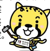
大会イメージキャラクター「アイチータ」

技能五輪・アビリンピックあいち大会2014で実施する競技に必要な旋盤、フライス盤を購入。大会終了後は、開校する愛知総合工科高等学校等で使用予定。