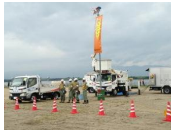
救助に向かう稲沢市消防本部職員 愛知県防災航空隊のマーク 協力企業・組合等による各種訓練 (写真は中部電力一宮営業所による緊急送電訓練)