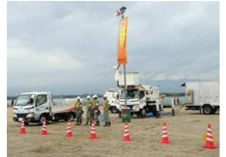
協力企業・組合等による各種訓練 (写真は中電一宮営業所による緊急送電訓練)