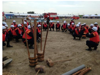
空輸された災害救助犬による倒壊建屋での要救助者の探索。住民の皆さんによる土のう造りと稲沢市消防団による堤防補強(月の輪工)