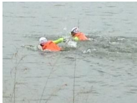
救助に向かう稲沢市消防本部職員