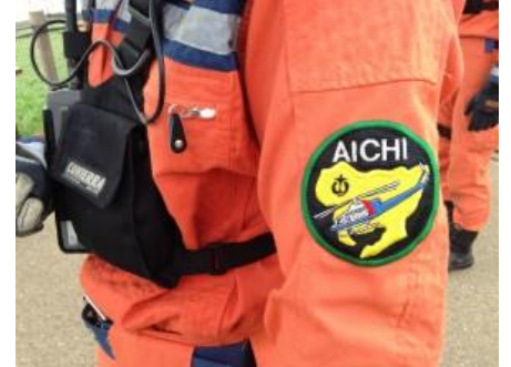
愛知県防災航空隊のマーク