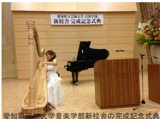
愛知県芸術大学音楽学部新校舎の完成記念式典

9月定例県議会が9月19日に開会しました。当初提出の議案は、所管する警察委員関係の交通安全施設整備費9千7百万余円等の一般会計などの補正予算関係3件、県税条例の一部改正など条例関係5件、高御堂住宅建築工事(第2工区)の工事請負契約の締結(請負契約金額7億2千万余円)等のその他議案12件の合計20議案です。鈴木は26日に、県営名古屋空港や災害医療対策などについて一般質問に立ちます。開会前から議論を呼んでいた、個人県民減税については初日提出までには至りませんでした。