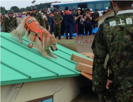
災害救助犬による倒壊建屋での要救助者の探索。住民の皆さんによる土のう造りと稲沢市消防団による堤防補強(月の輪工)