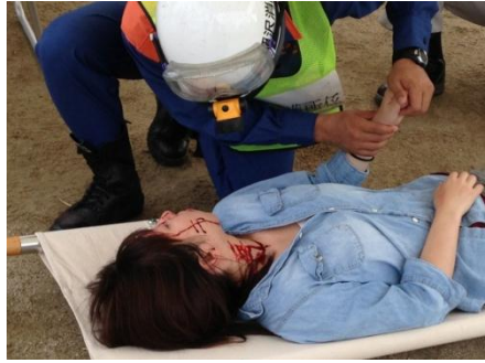
実戦さながらの負傷者の救急・救護措置、トリアージを待つ負傷者(傷はフェイクです)。