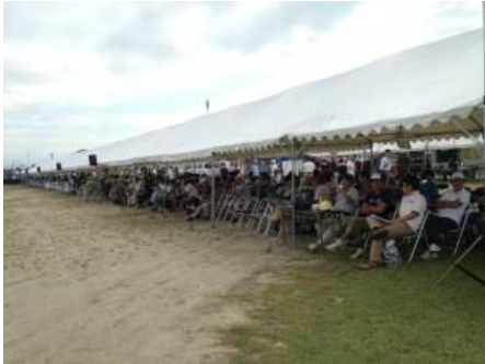
多くの区長さんに来場いただきました。