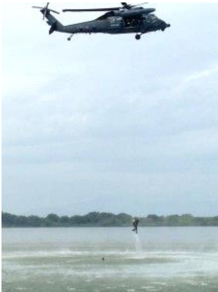
航空自衛隊小牧基地による水難救助訓練