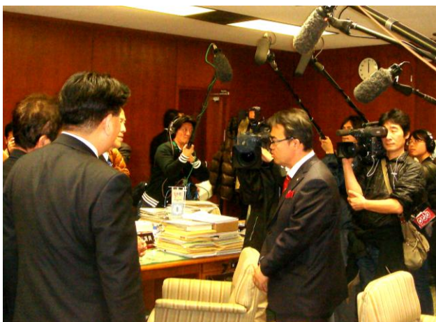
▲就任の挨拶にプレスと共に民主党県議団控室を訪れた大村新知事、出迎え？は5役ほか数人でした。

2月20日告示、2月6日投票の第17回愛知県知事選挙は河村名古屋市長とタッグを組んだ大村氏が150万票を獲得し他の候補を退け圧勝、戦後の公選知事として第6代の愛知県知事が誕生しました。名古屋市では河村市長が前回の最多得票をさらに上回る66万票で再選、住民投票も賛成が7割を超え、政権与党へのご批判、政権交代でも打破出来なかった時代の閉そく感、改革が進まない既成政党・議員・議会への不信感を背景に、トリプル投票の筋書き通り、製作・監督・脚本・主演の河村陣営に大きな民意が集まった結果となりました。