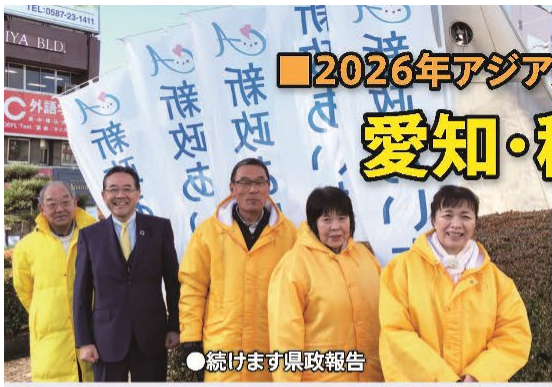
● 続けます県政報告