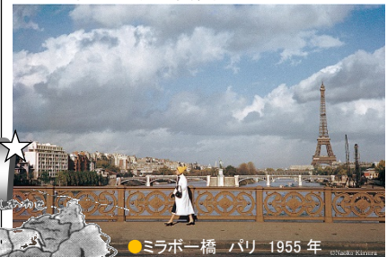
●ミラポール橋 パリ 1955年