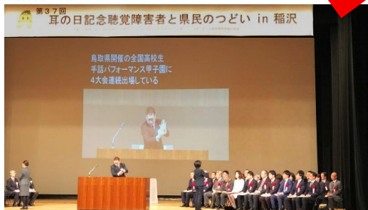
手話言語条例を制定した稲沢市で3月3日に『耳の日記念聴覚障害者と県民のつどい in 稲沢』が挙行されました。