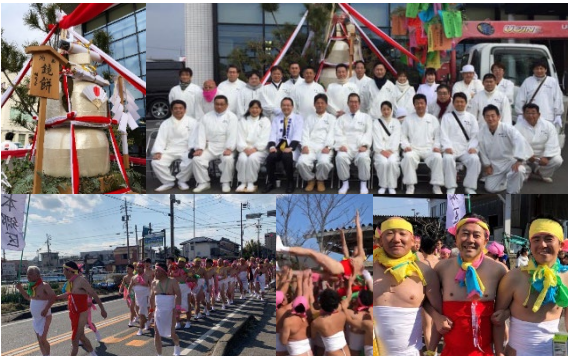
●稲青会で鏡餅奉納 1年遅れの赤下帯で儼追笹奉納しました。