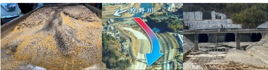
●日光川水系改修促進期成同盟会視察研修会 河川の流れの実験見学、狩野川は延長 46km で放水路は 700 億円、放水路は計画中に狩野川台風の襲来を受け計画を変更・強化、日光川は 41km で現放水路は 400 億円。

歳出は、扶助費 135 億円の増など人件費・扶助費・公債費の①義務的経費は 1 兆 2,821 億円(170 億円増、構成比 49.8%)、AICHI SKY EXPO や平針試験場の完成により②投資的経費は 2,796 億円(499 億円の大減 10.9%)、地方消費税関係や国勢調査費 35 億円を含む③その他経費は 1 兆 105 億円(927 億円の大減 39.3%)です。