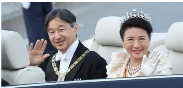
●祝！ご即位祝賀パレード (祝賀行列の儀) 挙行 沿道に 12 万人