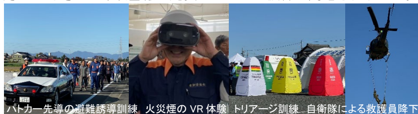
パトカー先導の避難誘導訓練 火災煙のVR体験 トリアージ訓練 自衛隊による救護員降下