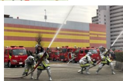
稲沢市消防出初式の勇姿