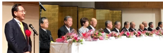
14 名の方が受章の榮に浴された叙勲・国家褒章祝賀会