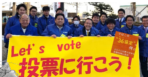
連合愛知尾張南地協で36協定の街頭+Let's vote