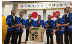
稲沢商工会議所の鏡開き