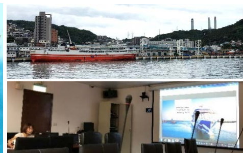
●台湾の面積は愛知の 7 倍、人口約 2,357 万人(3 倍)、GDP 約 69 兆円(1.7 倍愛知 40 兆円)、首都は台北市。

●再犯防止に向けた取組…420 万円 6 月に一般質問で取上げた 地域再犯防止推進ホテル事業 が新規予算として 9 月議会に提出されます。刑務所出所者等の職場安定支援、寄り添い弁護士制度による社会復帰支援など犯罪をした者等の立ち直りを支援し円滑な社会復帰を促進するためご理解・ご協力を宜しくお願いします。