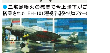
●三宅島噴火の慰問で今上陛下がご搭乗された EH-101(警視庁退役ヘリコプター) ●映画「永遠の 0」で使用された零式五二型実物大模型